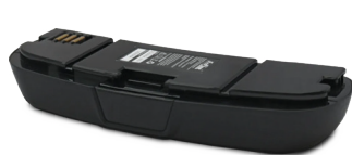
EV-08 Batteria standard a ricarica rapida

Il dispositivo prevede l'abbinamento a due diverse batterie, da selezionare a seconda del tipo di filtro utilizzato. Il caricabatteria è comune ad entrambe. Per la durata delle singole batterie vedere la sezione "DATI TECNICI".