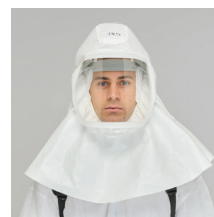
HL24 Cappuccio con copertura spalle