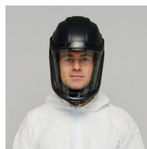
HV25 Visiera con elmetto integrato