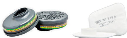
Filtri serie BLS 200