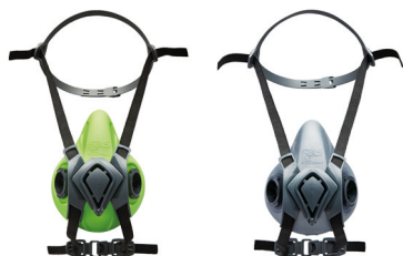
Semimaschere BLS 4000ne>>t S - BLS 4000ne>>t R