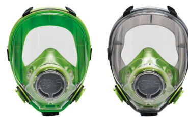
Maschere intere BLS 5700 - BLS 5600