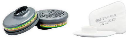
Filtros serie BLS 200