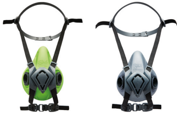
Medias máscaras BLS 4000ne>>t S - BLS 4000ne>>t R