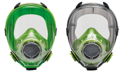
Máscaras completas BLS 5700 - BLS 5600