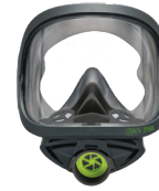
Máscaras completas BLS 2150 - BLS 2150V