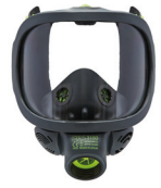
Máscaras completas BLS 3150 - BLS 3150V