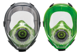
Máscaras completas BLS 5400 - BLS 5150