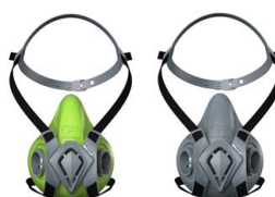
Semimaschere BLS 4000 ne x t S - BLS 4000 ne x t R