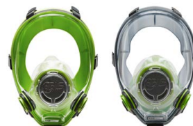
Maschere intere BLS 5700 - BLS 5600