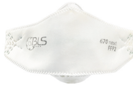
BLS 670ne>>t Taille M/L - Taille S