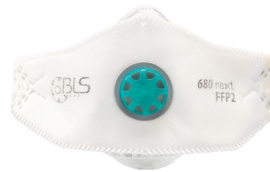
BLS 680ne>>t Taille M/L - Taille S