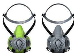
Semimaschere BLS 4000 next S - BLS 4000 next R