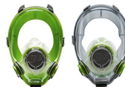
Maschere intere BLS 5700 - BLS 5600