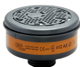
Filtri serie BLS 400