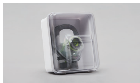
C90 – Contenitore appendibile.