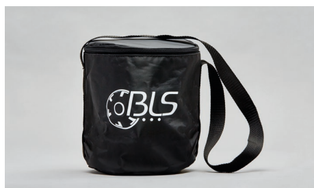
C41 – Borsa tessile con tracolla.