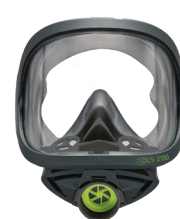
Maschere intere BLS 2150/2150V