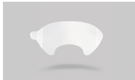
K19 – Coprischermo in acetato.