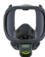
Maschere intere BLS 3150