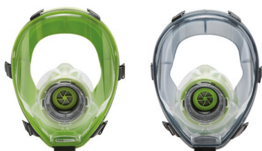
Maschere intere BLS 5400 - BLS 5150