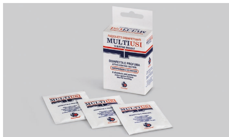
Q530 – Salviette disinfettanti multiuso.