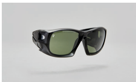
C22 – Montatura per lenti correttive.