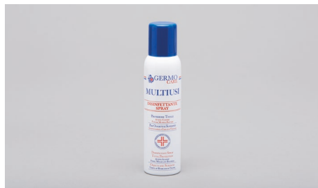
Q409 – Spray disinfettante (150ml).