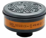
Filtros serie BLS 400