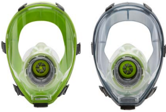
Máscaras completas BLS 5400 - BLS 5150