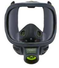
Máscaras completas BLS 3150 - BLS 3150V