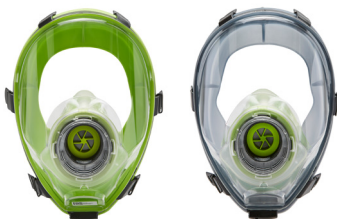
Masques complets BLS 5400 - BLS 5150