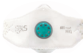
BLS 680ne»xt Taglia M/L - Taglia S