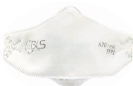
BLS 670ne»xt Taglia M/L - Taglia S