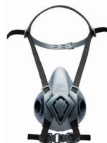
Semimaschere BLS 4000ne>xt S - BLS 4000ne>xt R