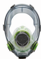
Maschere intere BLS 5700 - BLS 5600