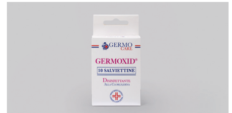
F595 – Toallitas desinfectantes multiusos.