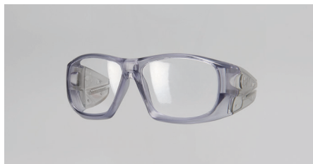
C22 – Montura para lentes de prescripción.