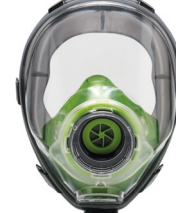
Máscaras completas BLS 5150 - BLS 5400