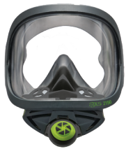
Máscaras completas BLS 2150/2150V