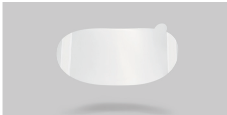
K16 – Lámina protectora en acetato.