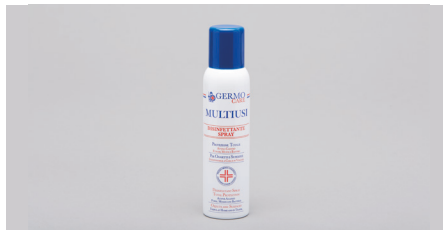
Q409 – Spray desinfectante (150ml).