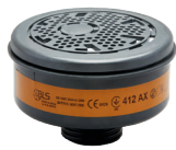
Filtros serie BLS 400