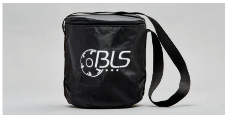
K41 – Bolsa textil para máscaras completas.