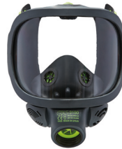
Máscara completa BLS 3150