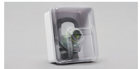
C90 – Contenedor de pared.