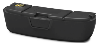
EV-09 Batería de larga duración con carga rápida