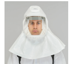
HL24 Capucha con cubrehombros