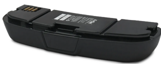
EV-08 Batería estándar de carga rápida

El dispositivo prevé la combinación con dos baterías diferentes, a elegir según el tipo de filtro utilizado. El cargador de baterías es común para ambas. Consulte la sección "DATOS TÉCNICOS" para conocer la duración de cada batería.